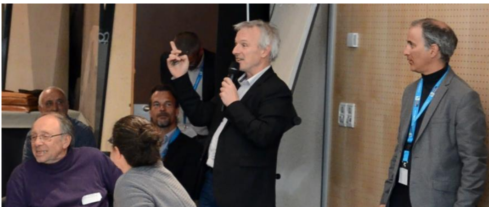
Clôture par Ch. Fournier