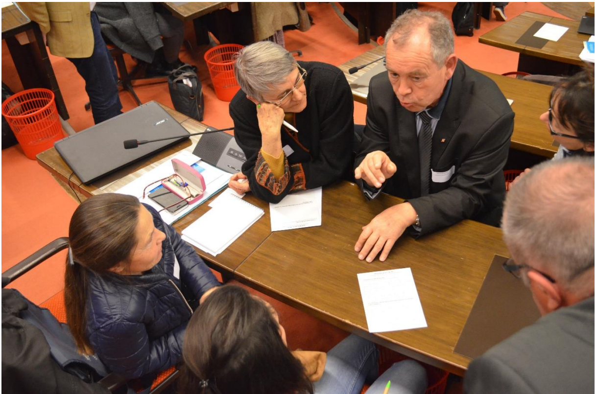
Présentation de la COP Régionale Questions/ réponses